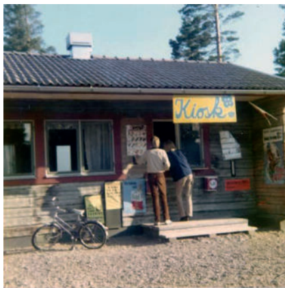
Kiosken 1970.

I det timrade husets ena ände kunde en kiosk placeras och ett fönster fick bli en enkel kiosklucka. Kiosken skulle drivas för Sollerö Segelsällskaps räkning. Föreningen skulle få vinsten och kunna förbättra sin ekonomi. Konsum Sollerön, Koopen , hade ett vilande kiosk-tillstånd vilket vi fick utnyttja. Varor, efter behov, inköptes i konsumbutiken och fraktades på flaket på en av killarnas