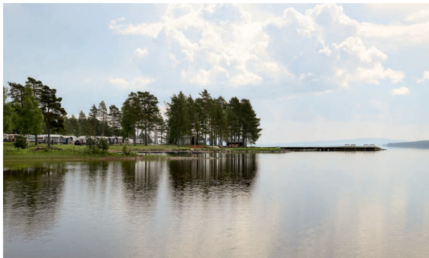
Sollerö Camping.

Kallt vatten var det enda som fanns att tillgå och de lite mer hygieniska utrymmena lyste fortfarande med sin frånvaro. Det blev dock möjligt att erbjuda campare att bo på Sollerön vid en badplats och de kunde få viss service även om det var mycket primitivt.