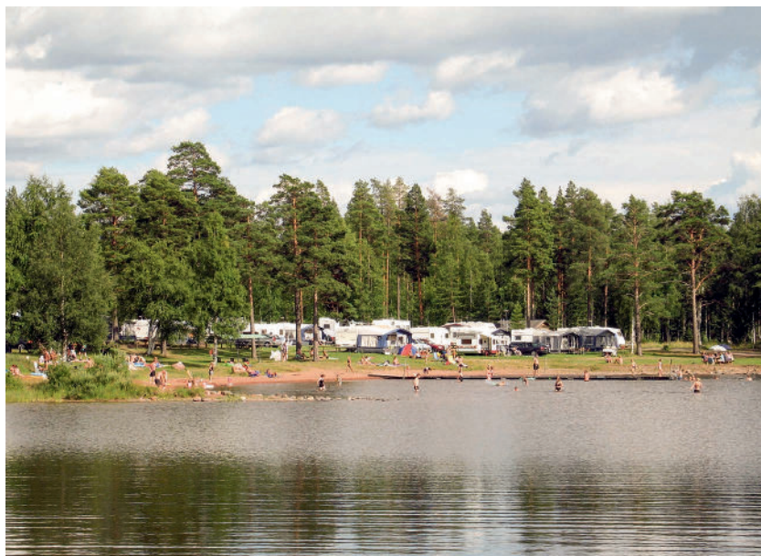
Campingen av idag.