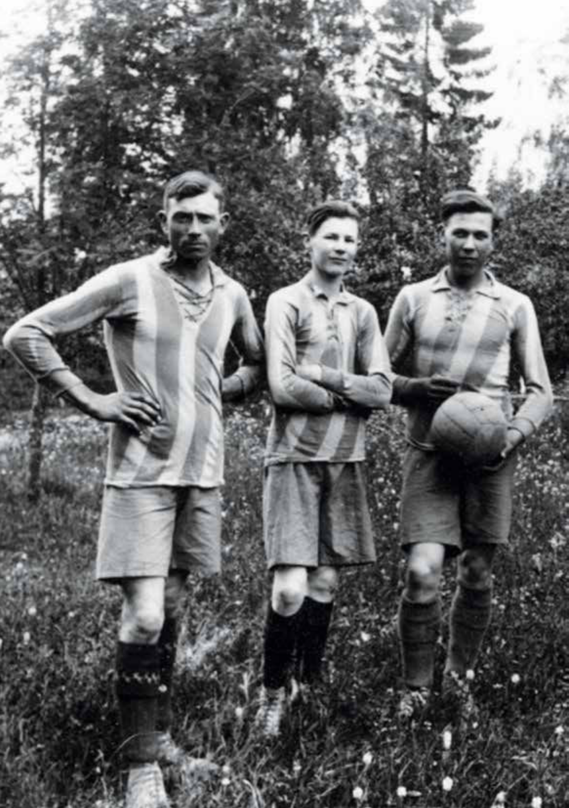
Bilden beskuren.