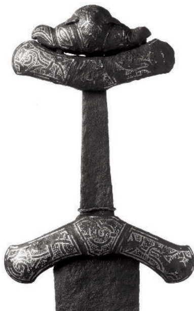
Detalj av svärd från vikingatid (800-1050 e.Kr.) från Bengtsarvets gravfält.