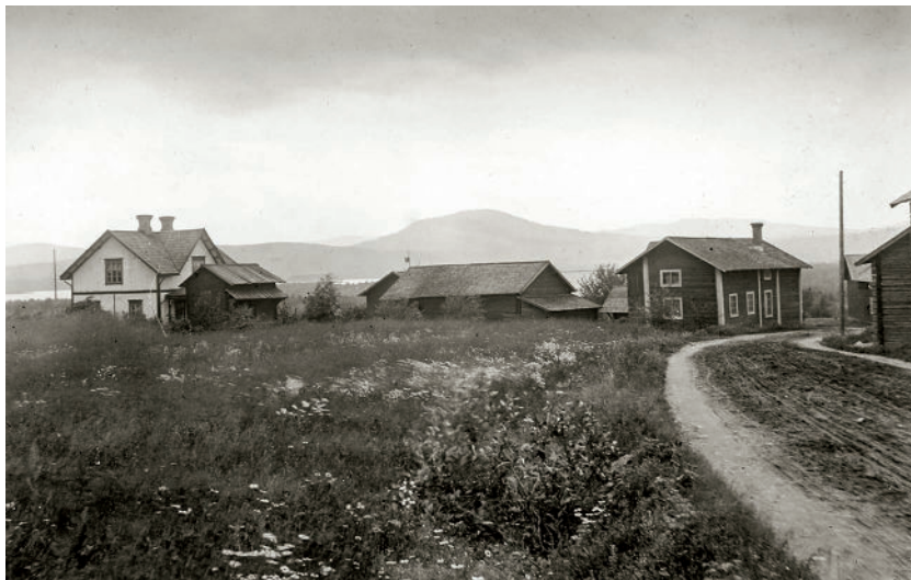
Lärkagården i Gruddbo på Sollerön 1920.