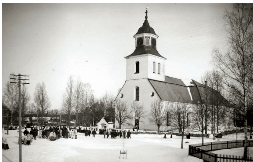
Sollerö kyrka.