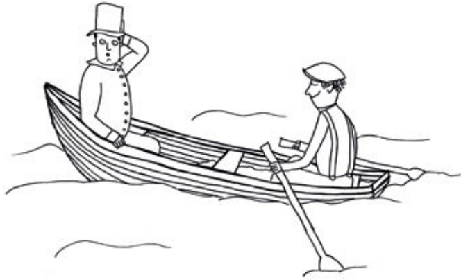
Teckning: Jessica Clegg

Fö ländj, ländj sä inå ä fanns någu brun a soldn va ä jänn karr så rudd fok milå Mora å Soldn fö je ålldär so liti betalningg. Jänn dag kam ä jänn fin karr å språkät släkså ärrskap bruka. Ann let så uvålin å frägät umm int dånn så rudd kund läråjt lite umm ulåjk dialåktår runtum Siljan.