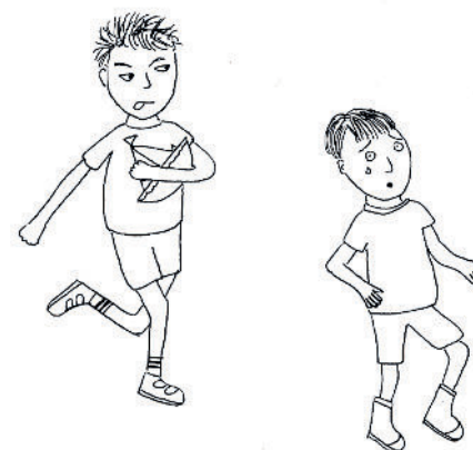
Teckning: Jessica Clegg

Glad-Järk add fylla tre år. Ann språkät bå svensko å soldmål. Jänn logdag kam ä jän kripp i sumu sturlek å Järk köjtät båta krippen å sulld sjå umm ä va nån ann kund a litä roli minn. Järk språkät upå soldmål å odär pöjtjänn värrt illsätt å köjtät darfrå. Järk sättäv ättär å galät: ”pöjtjänn, dritunggan, vänta, i vill läka!”