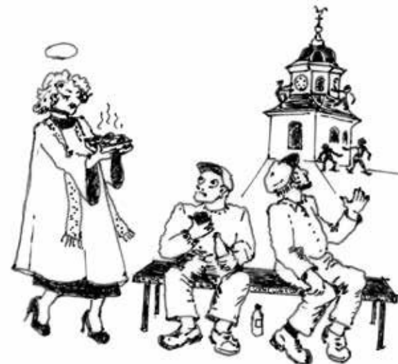
Teckning: Margit Andersson

Ä va mäss dämm ålldå lägät tornä upå soldtjörtjon. Ä va jänn stakk åv karrär så dövät å späjkät el dägå. Ä sä svor dämm så ä osät umm dämm. Båt Lena så va präst värrt alldeläs rolos. Jänn dag röstät o si i kaftan å prästkrågån, sä tog o je matdos å sätt si ata två åv karrum upå bantjim främåminn tjörtjon mäss dämm vöjlät si. ”A ir ärt tålås umm Jesus Kristus?” frägät o. Dämm glonät å ännå å jändör galät a karrum upi torni: ”Vitär ukän Jesus Kristus e?”