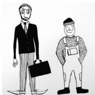
Teckning: Sara Halvarsson