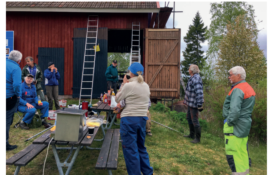
Målning av tröskladan