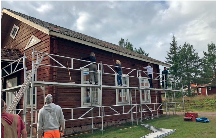
Målning av kapellet

sammanslutningar, bidrar till att hela interiören förmedlar en känsla av frid och andlighet.