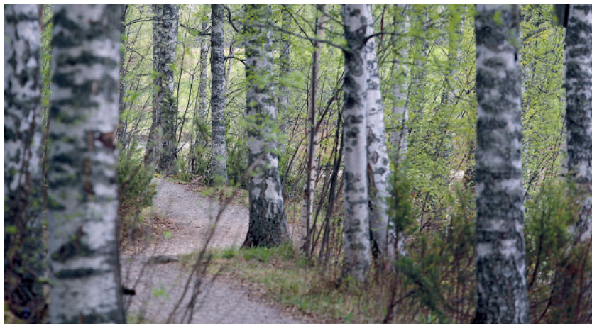
Stigen i Klikten.

Du plockar med dig ditt fynd som också pryds av ett bomärke. Om du träffar på länsman eller fjärdingsmännen förneka all kännedom om ditt innehav.