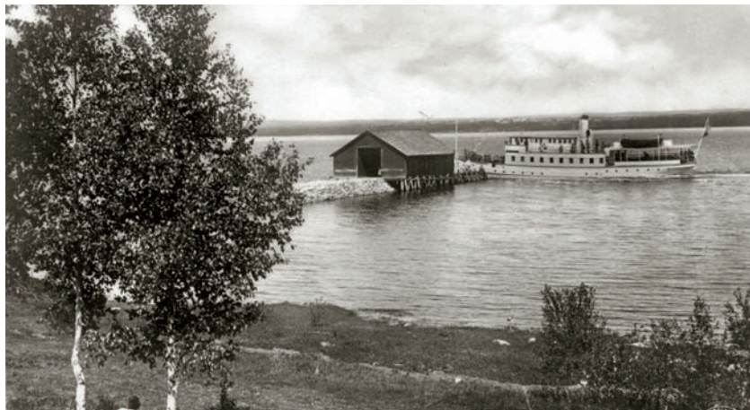
Gammalt vykort