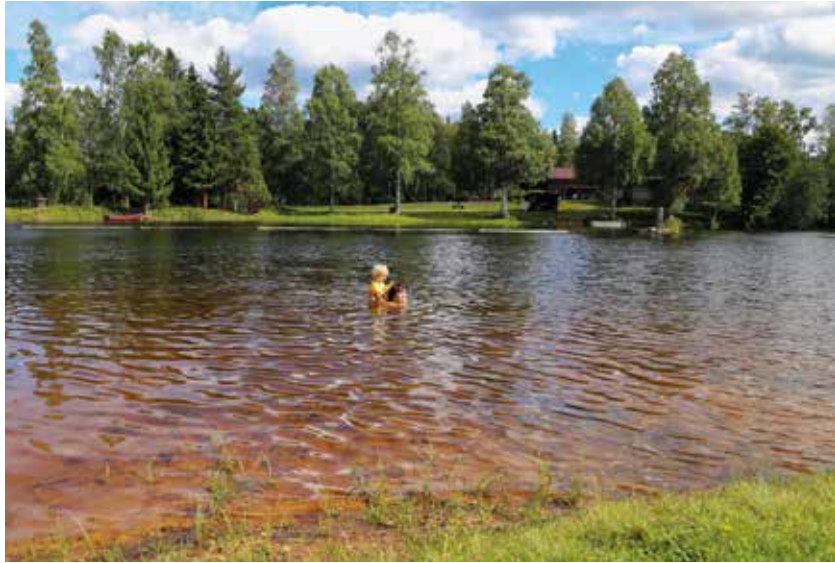
Bad i Mångbergs fåbodar.

”Nej, inte alls”, svarar jag lugnt. ”Lasarettet är bara 20 minuter bort. Inga köer i trafiken eller i vården. Mycket enklare på alla sätt, mer personligt. När jag låg där i våras fick jag sällskap av grannen så det blev riktigt trevligt. Skulle jag bli väldigt dålig har Region Dalarna samarbete med Akademiska så jag hamnar ändå där.