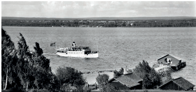
Här ses resterna av den gamla stenpiren.

För dem som var unga på 20- och 30-talet var den gamla stenpiren ett kärt tillhåll för bad. Det var en lagom distans att simma från ångbåtsbryggans bank ut till piren och tillbaka.