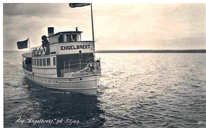
Ångfartyget Mora senare Engelbrekt

»Gustav Wasa« och »Engelbrekt« gick sina vanliga turer på Siljan, men säsongerna blev kortare och kortare, båttrafiken började uppfattas som långsam, när både bilismen och järnvägen var på stark frammarsch. Rederiets goda tider var över, och minskade under 1950-talet.