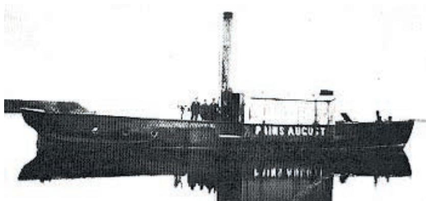
S/S Prins August i Insjöns hamn omkring 1898. Ångbåten är under ombyggnad till pråm och hjulhusen är bortmonterade. Båten ligger också högt i vattnet då man just monterat bort ångmaskinen.

ångbåt. Kanske en av de största händelserna under tidigt 1800-tal på Siljan. Hjulångaren »Prins August« uppkallades efter Oscar I:s yngste son som var hertig av Dalarna, av folkhumorn döpt till »Skovel August«. Fartygets huvuduppgift var att bogsera segelförsedda pråmar uppströms Dalälven. Båten var också användbar för fraktgodis och befordran av passagerare, ända upp till Orsasjön. Några tider gick inte att hålla beroende på väder och vind. Resenärerna fick anpassa sig efter detta och väntan kunde bli mycket lång.