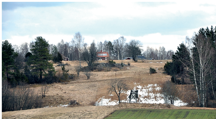
Figur 5. I bildens centrala del finns en störrestenssamling (precis nedanför huset med solceller). Den utgörs av en närmast kvadratisk konstruktion med påtagligt raka, stenlagda kanter i vissa delar. Bilden är tagen från Utanmyra och illustrerar väl hur anläggningen exponerar mot denna by på andra sidan om förkastningsbranten (Klikten). Strax till vänster om stenkonstruktionen syns en av gravarna på Bengtsarvets gravfält.

I västra kanten av Bengtsarvets gravfält på Sollerön ligger en märklig kvadratisk stenkonstruktion som möjligen skulle kunna utgöra en harg (Fig. 5). Den är 20 x 23 m stor och 1,75 m hög med en alldeles plan översida, närmast som en plattform. Två stenarmar leder ut från anläggningens östra del ner i backen mot Utanmyra. Formen för tankarna till kultplatsen vid Lilla Ullevi (Fig. 1). Anläggningen kallas ibland »begravningsröset« och det går förstås inte, utan arkeologisk undersökning, att utesluta