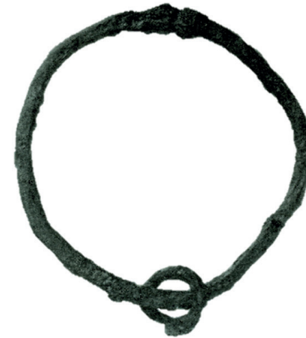
Figur 3. Stor amuletring med en mindre vidhängande ring från Borlänge i Stora Tuna socken. (Efter Serning 1966) 21

Ringar förekommer ofta i arkeologiska sammanhang men vissa typer kan tydligt kopplas till ett kultbruk. Då ringens form är mycket enkel och användningsområdena många är det svårt att uttyda vad en enskild ring haft för funktion. Det innebär att ringarnas arkeologiska kontext blir helt avgörande för hur de skall tolkas. Ringarna har tidigare ofta betraktats som ämnesjärn. På senare tid har tolkningen av dem som kultiska föremål lyfts fram. Omtolkningen är en följd av de fynd av ringar som gjorts på kultplatser som Borg, Helgö och Lilla Ullevi. Ringarna förekommer ofta ensamma, men en återkommande typ av ring-amulett är en större ring med tre vidhängande mindre ringar. Det finns många