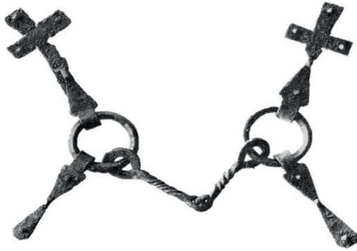
Figur 7. Betsel från grav 2 på Bengtsarvet/Häradsarvet. Observera de vidhängande rembeslagen som i ett fall är format som ett kors. (Efter Serning 1966) 21

som mycket intressanta att relatera till ett större sammanhang.