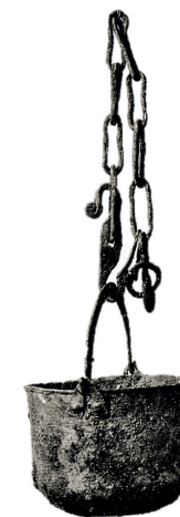
Figur 6. Kittel med kedja från grav 2 i Bengtsarvet, Sollerö socken. Notera den särskilt utformade nedersta länken (skärding) och de vidhängande amuletterna. Matlagning var en syssla som omgärdades av rituella handlingar, som så mycket annat i det vikingatida samhället. Kitteln är ca 20 centimeter i diameter. (Efter Serning 1966) 21

Som framgår av Tabell 3 är mängden hästskor som påträffats i vikingatida kontexter i Sverige mycket liten. I flera fall har dessa fynd framkommit i samband med exploateringar där arkeologer inte varit närvarande. Detta gäller framförallt dala-fynden. Det gör att några av hästkorna inte helt säkert kan knytas till de undersökta (och skadade) gravarna, vilket innebär att dateringen till vikingatid inte i alla kan anses säkerställd. Oavsett denna brasklapp, är anmärkningsvärt många vikingatida hästskor funna i Dalarna. Inte mindre än 66 % av de listade fynden i Tabell 3 härrör från Dalarna och över 30 % från Sollerön. I Norge känner vi endast till en hästsko från vikingatid. Intressant nog kommer den från Toten vid Mjösa, mindre än 20 mil från Siljan 18 . Det påvisar än en gång hästens betydelse i Dalarnas vikingatid samhälle. I ljuset av detta faktum framstår gravarna på Bengtsarvet