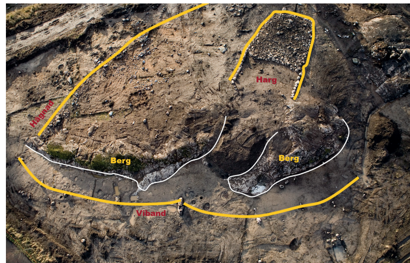
Figur 1. Flygfoto av viet (den heliga platsen) i Lilla Ullevi. Den konstruerade stenplattformen (hargen) syns i bildens övre del. Även berget som sträcker sig genom bildens mitt kan betraktats som del av hargen. Platsen är hägnad av stenar och en rad av stavar/stolpar (viband) som varit upplysta med eldstäder.

Exempel på sådana platser är Götavi i Vintrosa socken i Närke 3,4 och Lilla Ullevi i Bro socken i Uppland 5,6 . I Götavi hittade arkeologerna bland annat en stor stenplattform (en harg?) i en sankmark.