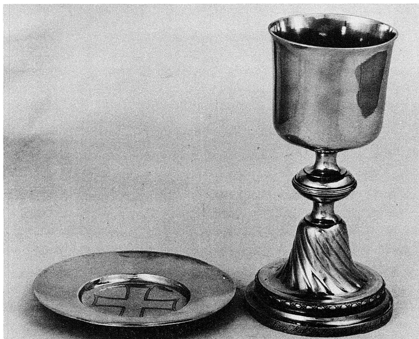
Kalk och patén av förgyllt silver. Gåva 1788 av drottning Sophia Magdalena.

icke allenast afhämtat berörda gåfwa utan ock fått den nåden hos Hennes Konglig Majjstätt Drottningen å sina och församlingens wagnar aflägga deras underdånigaste tacksäjelse, så blefwo de anbefalte genast begifwa sig hem till Påska högtiden med silfret. — Resan företogs den 27 Martii förbi Westerås den 29 följande at bestyra om 500:de Stamböcker, och anlände lyckeligen hem med den kongliga gåfwan, sedan de warit borta i 53 dygn och derföre njutit 4 D Kopmt hwardera om dagen.