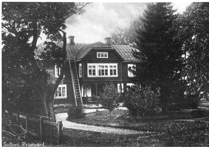
Sollerö prästgård från omkr. år 1930