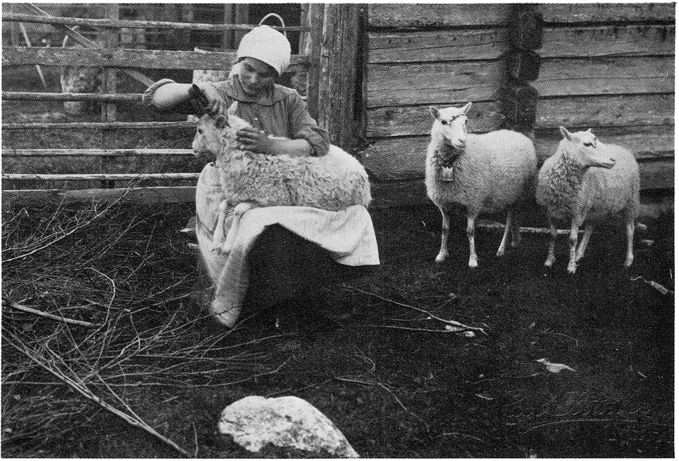
Markus Stina klipper fåren.