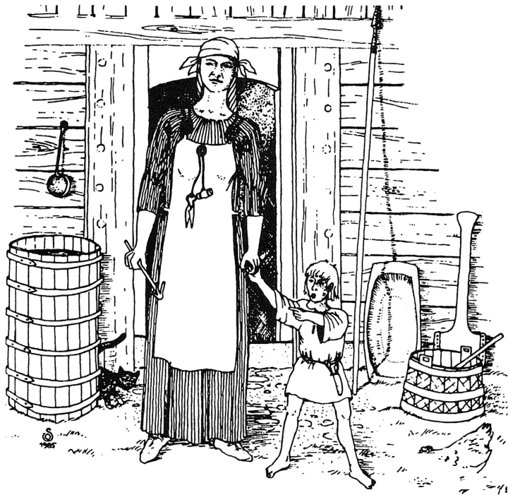
Kvinnodräkt och barndräkt från vikingatiden. Teckning: Danils Sven Olsson.

Som överplagg bars en sjal som hölls ihop av ett litet ringspänne, eller en kappa som man fäste ihop med ett spänne. Knappar från vikingatid har inte hittats, däremot kunde en pärla och sydd ögla fungera som knapp.