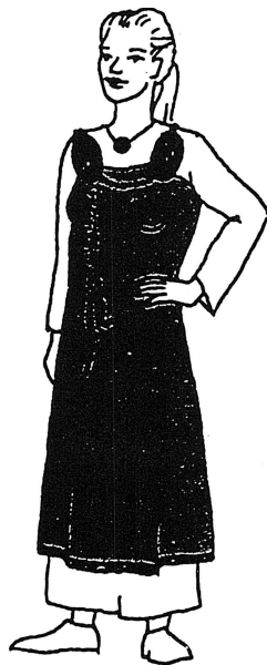
Skandinavisk kvinnodräkt med ovala spännor

På huvudet verkar man ha haft en knuten duk som ett huckle, eller bara ett vävt mönstrat pannband. Håret ser ut att ha varit uppsatt i en konstfull knut. Inga bältesspännor har hittats i kvinnogravar, så om kvinnor hade ett bälte var det då troligen ett vävt band som knöts runt midjan.