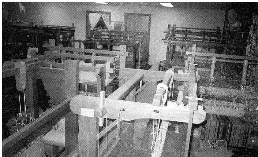
28 vävstolar i gång! Hit kan alla komma och väva, dag och kväll.