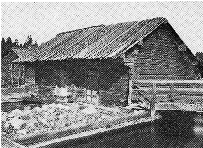
Mångberg-Holens parkvarn Mångberg

och därtill bidrog många orsaker. Nutidsmänniskan som lever i våra moderna samhällen, där det är ljust hela dygnet, har naturligtvis svårt att förstå något sådant. Men skvaltkvarnen låg ju vid ett brusande vatten, ofta med höga granar ikring. Där fanns förutom själva kvarnbyggnaden den lilla kvarnstugan sammanbyggd med ett litet stall med ett lider emellan, vidare ett litet härbre att förvara säckarna i, alltså en hel liten gård. Inne i stugan brann en liten eld på spisen. När man i mörkret skulle gå ut och se till kvarnen, fick ett tjärbloss ersätta vårt moderna ljus och våra lampor. Och vidare får vi ej glömma, att det för våra förfäder var en realitet att det fanns andra varelser: skrömt, rondan, troll, näcken, och framför allt här — ”Forskall” (strömkarlen). Höll man sig vän med forskall och kastade någon köttbit ner till skovelhjulet, så kunde man få lära sig spela fiol. Han kunde också se till kvarnen, och ibland hände det att han ryckte upp den lilla stugdörren, då mjölnaren slumrat till, och ropade: ”Ä a meli åv a di!” (kvarnen går tom).