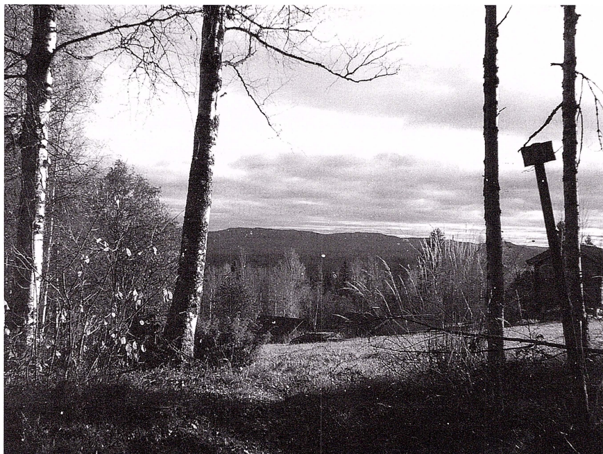
Höstlig vy vid Hjulbäcksåsen. Leden skyltad till höger på bilden.

macka vid fikapausen utanför Hjulbäcksåsen? Fika är oerhört viktigt för att ha energi att gå genom skogen ner till myren vid Svartjärn.