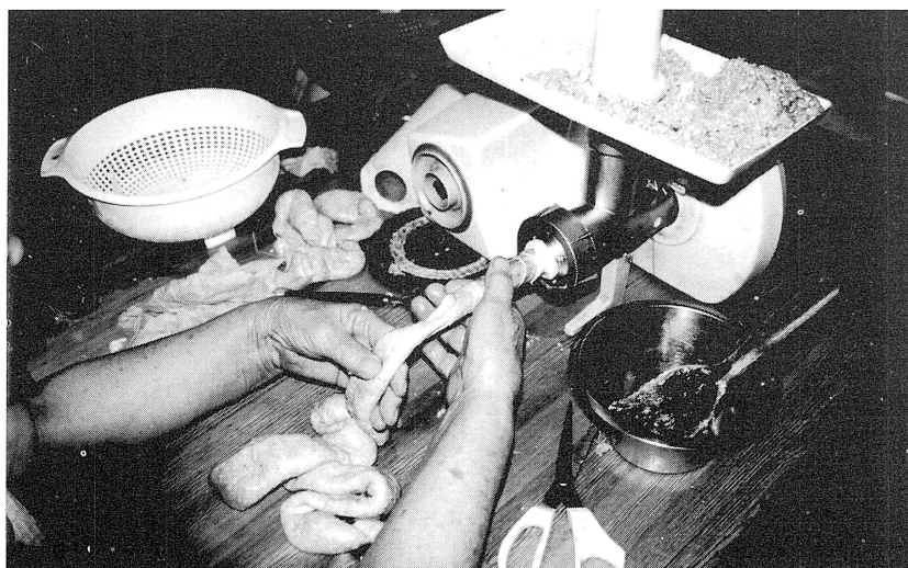
Fjälstri fyllas minn kårrvsmetn.

Nu e ä tä blannnd iop ä uti jätt trug älld ana kräld. Bruk nävä å blannnd minn, ä bi bässt, då kännäs ä bässt då ä e bra blanda. Stjinnä sa spoläs genum minn källt vatn inå ä dras upp upå kårrvvännä, sä e ä tä dra igång kvänni å djärå kårrvän.