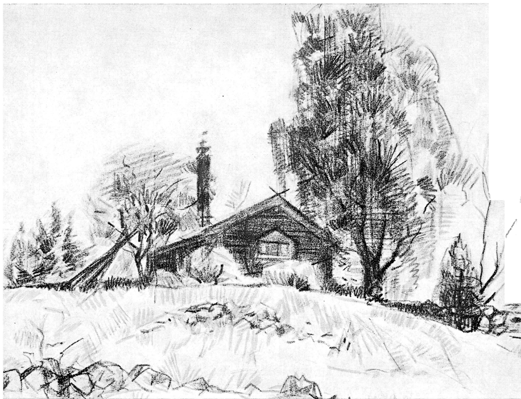
Teckning av Elon Garp.