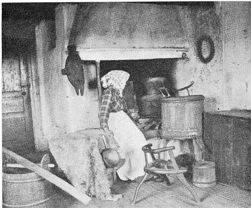
Interiör med husbehovsbränning.

Sollerön kort före julen 1860 för husvisitationer och beslag av brännvinspannor i gårdarna.