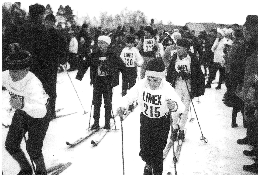
Skolskidtävlingarna på 60-talet tilldrog sig stort intresse såväl av deltagarna som publiken. Här startar ett par unga åkare och flera väntar ivrigt på sin tur.