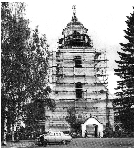
Under slutet av 60-talet ikläddes kyrkan byggnads- ställningar för renovering och omfärgning till den något omvistade rosa färgen. Foto: Gustav Nilsson 1969.

Den dag -67 som högertrafiken infördes fick jag åka med en lekkamrat och hennes föräldrar till Mora för att prova på denna begivenhet i ”stadstrafik”. Allt gick bra ända tills vi nått fram till kyrkan i Mora, där återföll pappan i vänsterbeteendet och körde på fel sida om refugen, till stor munterhet för ungdomar som placerat sig på parkbänkar som publik till trafik-kaoset. Min kamrat och jag skämdes och sjönk djupt ner i baksätet på bilen.