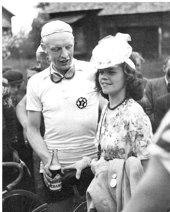
"Cykelåkaren" och flickan.

Impulserna från yttervärlden förmedlades genom den blå batteriradion Luma, köpt i Ryssa konsum. Sveriges Radio hade ett enda program med varierande innehåll. Plötsligt inträffade ett fenomen som fick hela Sveriges folk att sitta klitrade vid radioapparaterna på lördagskvällarna mellan 20-21. Programmet "Karusellen" hade slagit igenom och Lennart Hyland fick folk att gå ut på stan och göra de mest vansinniga saker. Ordet "kändis" fanns inte, men nog blev Snoddas en sådan efter att direkt från bandyplanen kliva in i Karusellen och göra succe med sin "Flottarkärlek".