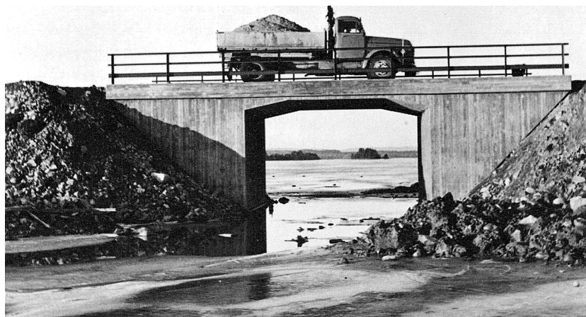
1957. Sundsbron börjar bli färdig. Här passerar den första lastbilen.

Mora-Sollerön. Påtagligare var i så fall den nya Sundsvägen och Sundsbron, som kortade vägen mellan Sollerön och Mora betydligt. I samma veva asfalterades "landsvägen" och ön kom en aning närmare fastlandet, till fromma för alla som arbetade i Mora, för Erlandssonsbussarna, mjölkbilen m.fl. Nu plöjde man i "invallningen", grävning för kommunala va-ledningar för Sollerö centrala delar påbörjades. På Gesundabergets norrsida var slalombacken färdig.