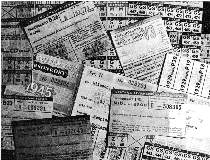
Exempel på den mångfald av ransoneringskort som fanns utdelade, t ex kaffe, matfett, bröd, kött och fläsk, socker. Särskilda restaurangkuponger fanns och personkortet utgjorde stommen i tilldelningen. Det klipptes och klistrades i det oändliga i kristidens butiker.

hade nog legat i förråd under ansenlig tid.