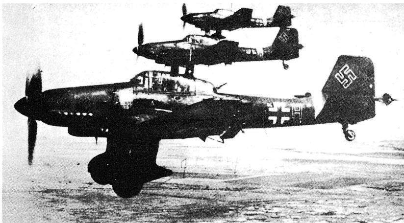
Tyska stridsflygplan över det neutrala Sverige — en skrämmande syn under krigsåren.

Mörklägning påbjöds och man fick antingen ordna med mörkt papper för fönstren eller låta släcka lyset. En höstkväll var det mörklägningsövning och det blev en regelrätt folkvandring till kyrkbacken, där man stötte samman med många famlande personer i beckmörkret. Alla skulle dit och se hur övningen fungerade.