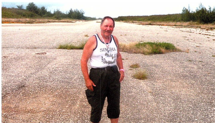
Sune Nishans på Tinians startbana för Hiroshima-bomben.

jag frågar har ingen aning och ändå är det gammal världshistoria. Nu får ni lära er i denna artikel. På denna ö lastades atombomberna, som fälldes över Hiroshima 6 aug 1945 och Nagasaki 9 aug 1945. Härifrån startade B-29 bombflygplanet ”Enola Gay” med som enda last den 6 000 kg tunga atombomben av uraniumtyp kallad ”Little Boy” sin 12-timmars flygresa tur och retur Hiroshima. Bomberna var så pass tunga att lastningen måste ske på så sätt att en grop grävdes i marken där de placerades, och sedan fick flygplanen taxa över gropan varefter bomberna kunde hissas upp i planen. 35 ”Little Boy” hade levererats till Tinian med kryssaren USS Indianapolis. En vecka senare torpederades den av en japansk ubåt. Ytterligare en atombomb, denna gång av plutoniumtyp, krävdes innan Japan gav upp.