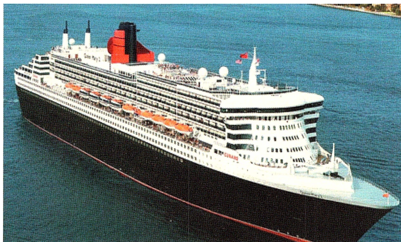
Queen Mary 2 tillhörande engelska Cunard-rederiet.