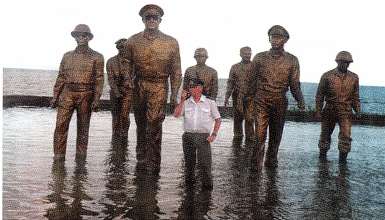
Minnesstaty över Mac Arthurs återkomst från Australien.

I en andra utflykt från Manila flög vi 1½ timme söderut till ön Leyte, i vars närhet 2:a världskrigets största sjöslag ägde rum. Där ligger 100-tals krigsfartyg på botten. Det var också här, som MacArthur vid sin återkomst från Australien den 20 okt 1944 kunde säga: ”I have returned”. Vi bodde i Leytes största stad Tacloban, som mest var känd som före detta presidenthustruns födelsestad. Imelda Marcos blev på sin tid världskändis med sina 3 000 par skor. Nu har Tacloban blivit känd av en annan orsak nämligen: ”Staden finns inte längre”. Fredagen den 8 november 2013 drog tyfonen ”Haiyan” in över staden och raserade allt. Till och med vårt hotell, som låg på en kulle, är borta. Om MacArthurs landstigningsminne 10 km utanför staden finns kvar är okänt. Förödelsen har ju visats på TV och i alla tidningar.