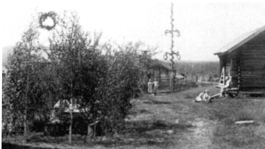
Majstångsresning i Trunden år 1921.

Nästan allt manfolk var ute på skogsarbete på vintrarna. Så även Tromben, som hann med många vintrar i skogen. Gäddtjärnberg, Görsjön, Mossabäcken, Säxen, Gruvan, Seliträd, Filtjärn, Sälen och Stortjärn nämns. Vid Stortjärn skulle ett arbetslag på omkring tjugo man trampa en väg från Säxen. Avståndet mellan sjöarna är ca 6 km, men snön var så djup så det blev en dryg dag. Utan något att dricka och utan matsäck tröttnade många, även Tromben. Endast några unga och starka orkade hålla igång och kom fram i tid. Alla kom så småningom fram och efter att ha vilat ut kunde arbetet börja.