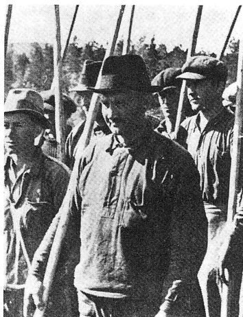
Tromben, basen, framför flottarna.