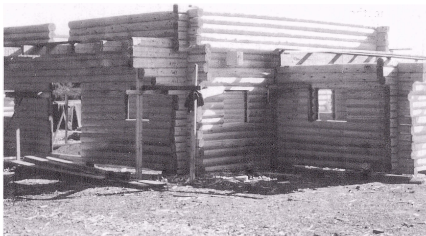
Första huset timras vid "Ägni".

Grova raka utvalda granar avverkades manuellt och med Ferguson 165 drogs stockarna upp till landsvägen.