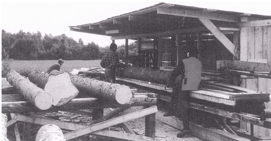
Såg på Ägni, som köptes för Tomtebygget.

Rullpersojkarna gjorde ett litet "provhus" enligt Tomtens direktiv, rundtimmer, raka knutar, knutändarna buckliga, och sen brändes utsidan med gasolbrännare för att snabbt få ett åldrat utseende. Provhuset står i dammen mellan Tomtens verkstad och Tomtens hus.