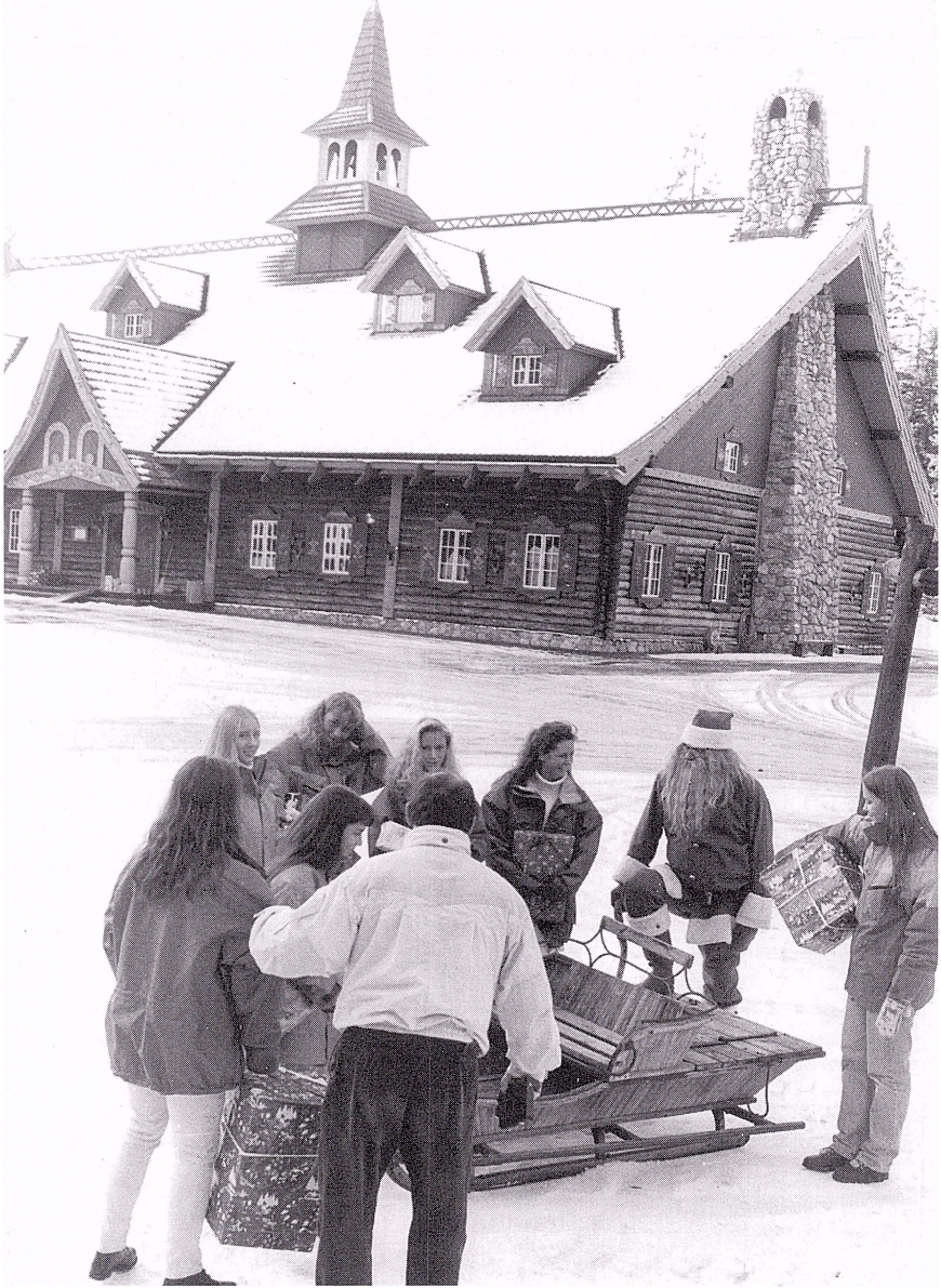
Tomten med sin släde framför verkstaden.