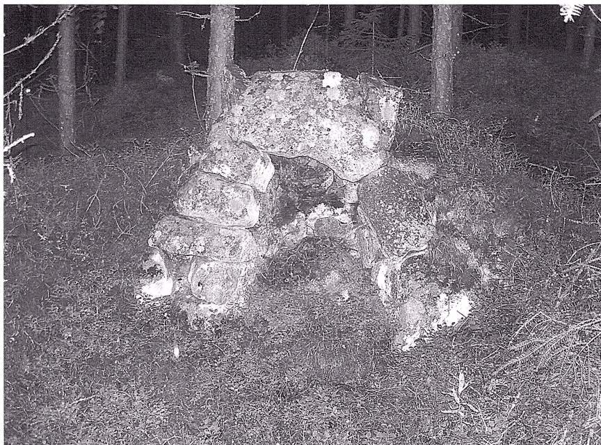
Tomtens kojrum. Väl värd att bevaras och fantisera kring.