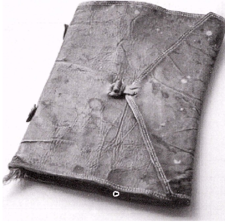
Bild 1. Det äldsta bandet vi analyserade var en tysk lagbok från 1282. Omslaget bestod av ett rödaktigt skinn som var fodrat med tunnt ljusst skinn. Runt om ytterkanten löpte dubbla rader förstygn. Boken som var 29,3 cm hög och 20 cm bred hyste en inlaga av pergament som bestod av 48 sidor fördelat på 3 lägg. För att inte ark skulle kunna avlägsnas från boken hade man knutit alla lägg tillsammans med silkestrådar som därefter förseglats med vax.