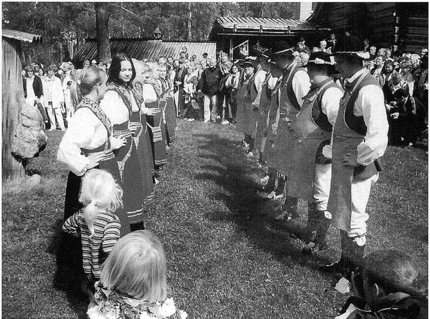
Folkdanslag vid dansuppvisning på Sivarsbacken i Våmhus. Karlarna bär morastjimpor.