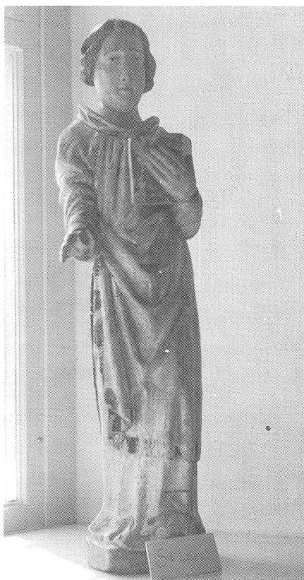
Bild av Laurentius figur i Sollerö kyrka

År 1782 var arbetet med Sollerö kyrka så långt kommet att gudstjänst kunde hållas där. Det återstod en hel del inredningsarbete innan kyrkan var helt klar, 1785. För inredningsarbetet behövdes en hel del material. Solleröborna beslöt då att riva S:t Laurentius kapell för att få byggnadsmaterial. Flera inventarier flyttades till den nya kyrkan. De idag bäst bevarade är predikstolen, fem medeltida träskulpturer, en ljuskrona, processionskrucifix samt en Sanctus-klocka i malm. Bland träskulpturerna, som idag står i dopkorets fönster, finns S:t Laurentius. Han är iförd vit mässkjorta, dalmatika (kåpa) och halslin. Diakoneus liturgiska kläder i den tidiga kristna kyrkan. Alba, ”diakonhake” och krage. I vänster hand håller S:t Lars en öppen evangeliebok men attributet i hans högra hand är försvunnet sedan länge. Men det torde ha varit ett kors, eller ett halster men även en penningpung eller ett stycke bröd.