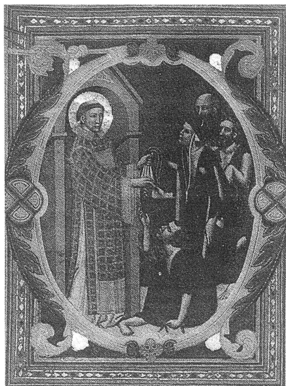
Den helige Laurentius

Laurentius väckte många sociala samvete då han tågade till kejsarens palats med fattiga, sjuka och lytta. Kejsar Valerianus däremot kände sig givetvis hånad och offentligt utskämd. Han hade förväntat sig goda