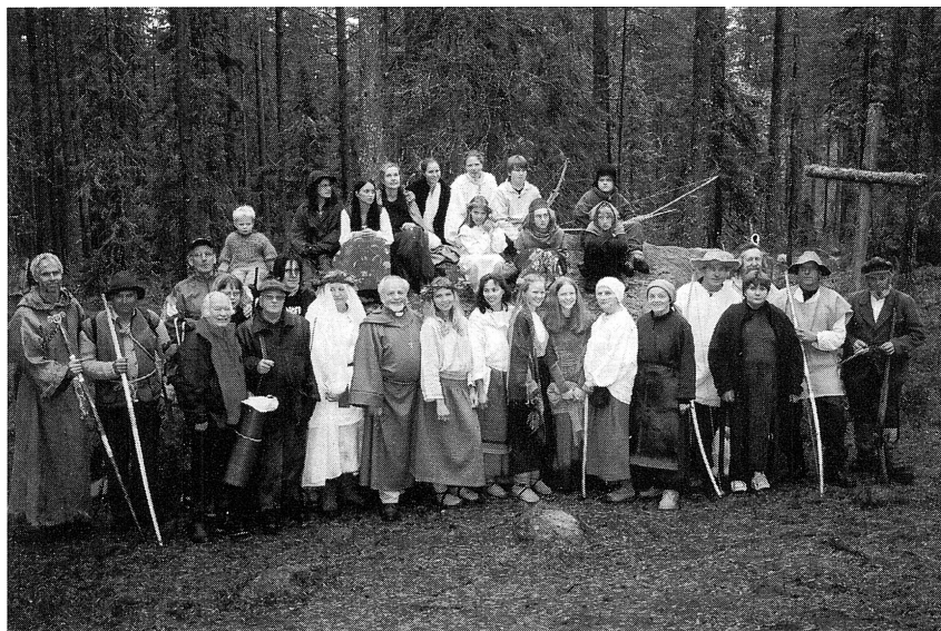
Aktörer i "Spelet vid Malibambo" 2003.