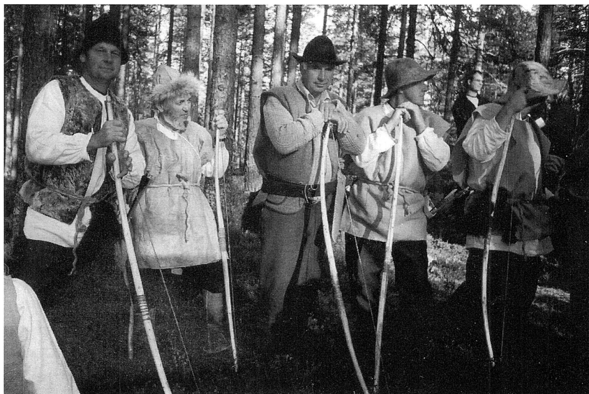
Fem Utämörkallär har varit ute i skogen för att jaga ekorrar till skatten.