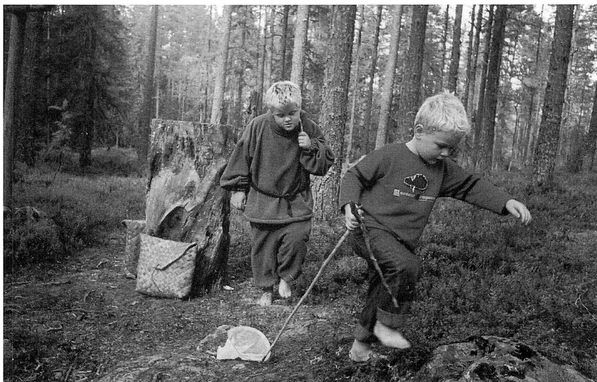
Småtomtar på väg. De skall till Långsjön och meta.