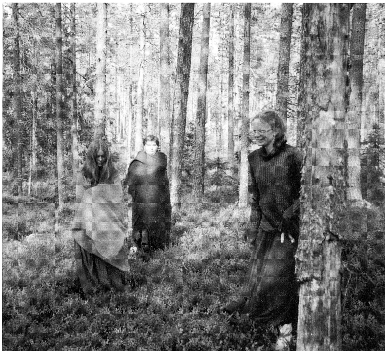
Rådn kommer fram ur skogen