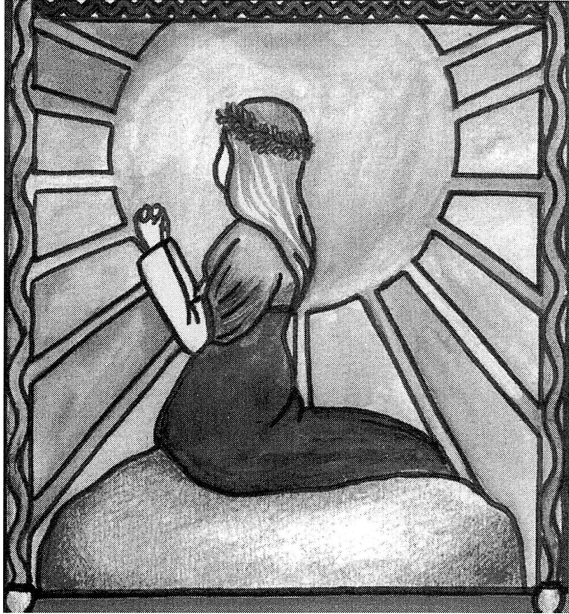
Malin på stenen Teckning: Anna Sohlin

Allt och alla har sitt ursprung ur något litet. När man betraktar naturens skapelser, människorna och djuren omkring en, är det otroligt att tänka sig att allt en gång varit ett litet, litet, knappt synbart frö. Likaså när en liten tanke gror till en idé och sen får växa sig till något så stort att det blir verklighet för så många andra. Så känns det när jag tänker på spelet om Malibambo.