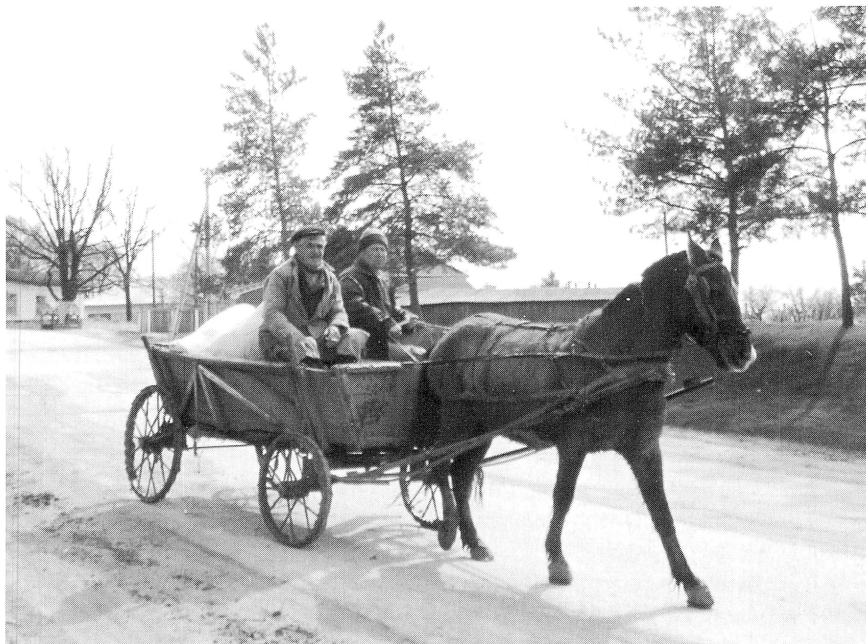
Hästekipage på bygatan.

Det är oerhört viktigt att människor på gräsrotsnivå får information och utbildning för att bli motiverade att förändra sin tillvaro och anpassa sig till den marknads-ekonomi som dom i de flesta fall blivit tvingade till utan att förstå innebörden av den! Borde inte biståndspengar kunna användas till sådan information och utbildning är min ständiga fråga!