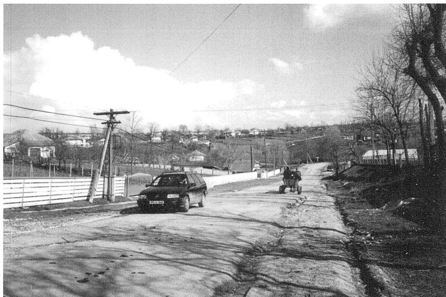
Huvudvägen mot Zaicani.