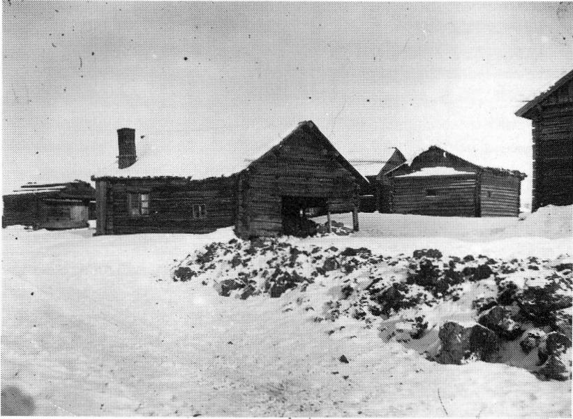
1917. Nisigården — Starkens hem. Ladugården hopbyggd med bostaden.

hus förbrukades till bränsle, medan veden på hans skogsskiften fick ruttna ned.