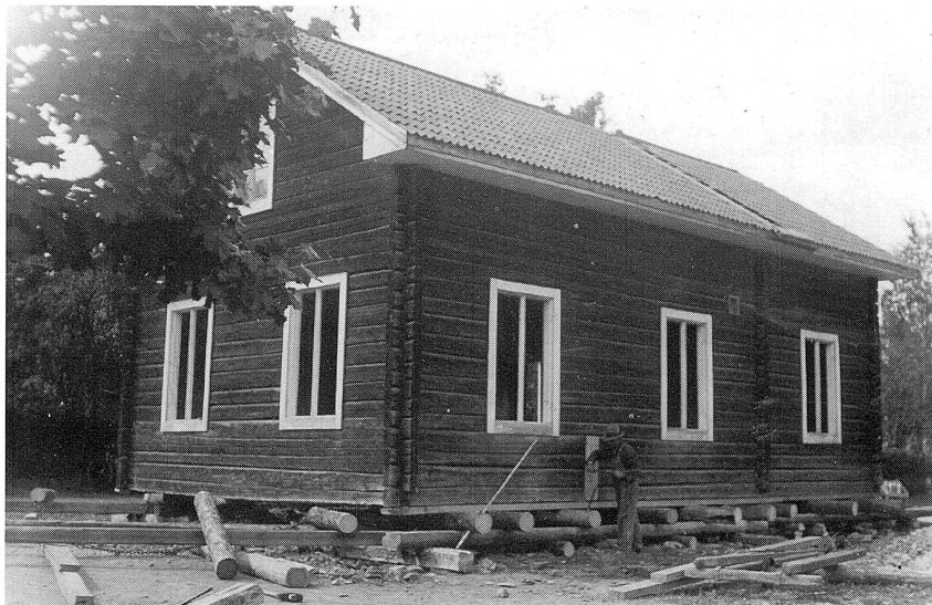
Sockenstugan på rullar.