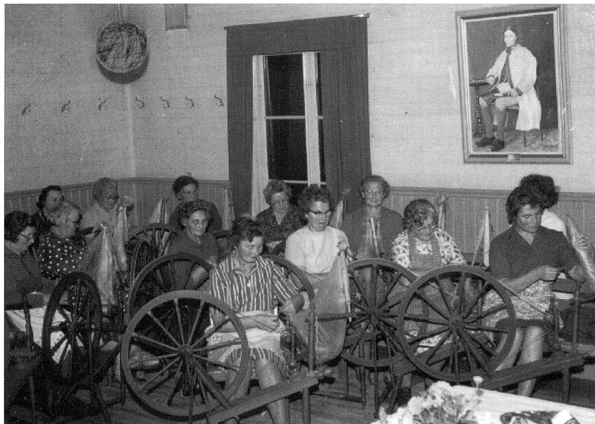
CKF – Centerns Kvinnoförbund – har spinnkväll i sockenstugan. 1966.

av olika slag som förekom i samband med det år 19465 beslutade laga skiftet. 1952 behövde Konsum sina lokaler i "Kopen" och för kommunen var nu sockenstugan enda alternativet, varför det mindre rummet åter blev kommunalkontor, men även sparbankskontor.