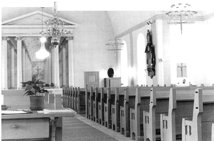
Interiör från Sollerö kyrka.

Indelningsdelegerade som enligt beslutet i stiftsstyrelsen fick beslutanderätten i det nybildade pastoratet tills t o m 31 december 2005 var i princip kyrkofullmäktige i "gamla" Mora kyrkliga samfällighet med den justeringen att Mora församling och Våmhus församling fick vardera ett mandat mindre till Sollerö församling som fick 2 mandat i församlingen. Indelningsdelegerade, med representation från Sollerön, har således under 2005 beslutat i alla frågor som har bäring på framtiden