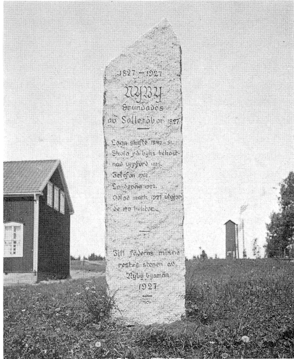
Minnensstenen i Nyby