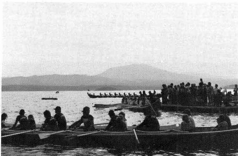
Kyrkbåtar i Kulåra.

på alla gårdar, och man har börjat lämna mjölk till mejeriet i Mora. Mjölken fraktas upp till landsvägen för vidare transport med buss.