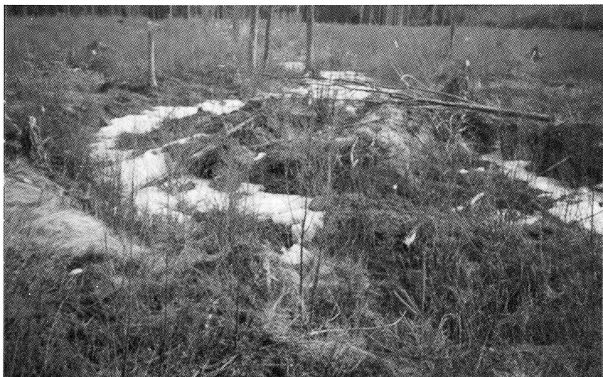
Plats nedom Svartntjärn, där svarvarstugan stått över bäcken.