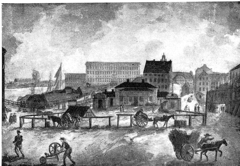
Utsikt över Norrmalmstorg i Stockholm vid mitten av 1700-talet (nuvarande Gustaf Adolfs torg). Efter akvarell av Isak Kjölström.

Dalkarlarnas resning mot överheten måste ses som ett uttryck för en demokratisk idé om folkets suveränitet. Med den upprors-tradition som fanns rotad i Dalarna, vågade de ett företag, som ”stort tänkt och fumligt utfört blev till ett oerhört slöseri med kraft utan motsvarande resultat” som det har uttryckts. Att det blev Dalarnas bönder som utförde detta sista uppror, berodde på att allmogen här ägde större självständighet än annorstädes, dels för att i Dalarna inte fanns jordägande adel, dels att socknarna — särskilt kring Siljan — hade god organisation och fast sammanhållning. Dessutom hade ”herrarbetena” skapat en stor grad av rörlighet och vidsyn. Folket var även i mindre grad uppdelade i rika och fattiga än i övriga delar av landet.