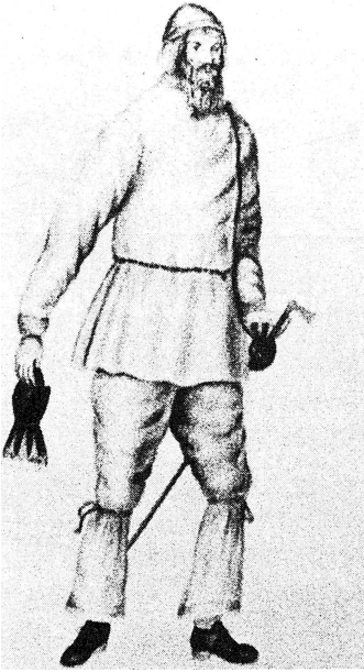
Morabonde från början av 1700-talet. Efter akvarell av okänd konstnär.