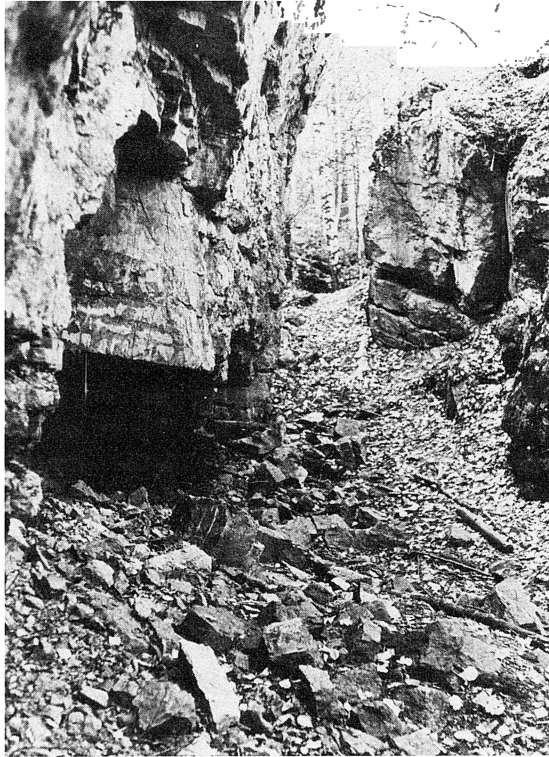
Interiör från gruvan med skiktrika kalkstenshällar i den lodräta bergväggen.

Kopparbergs län, varuti inmutningspunktens läge närmare angifvet sålunda: vidpass nio (9) meter sydväst om ett kalkstensbrott, vidpass fjorton (14) meter vestnorr om ett åkerhörn och vidpass tjugofem (25) meter sydost om en myrkan.