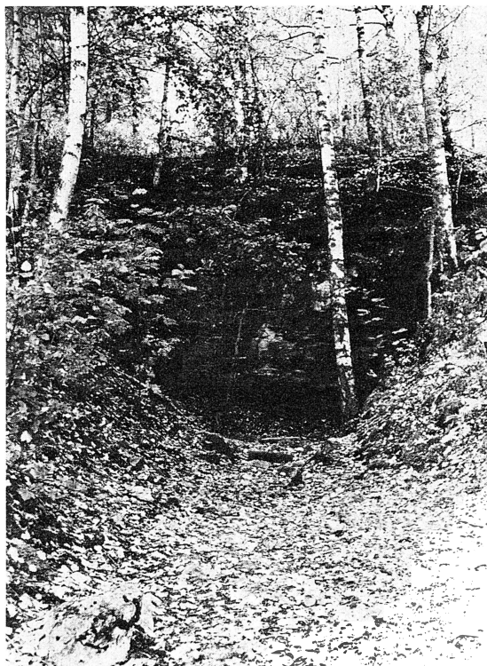
Gruvöppningen döljs numera av artrik vegetation och lummig lövskog.

ra försök gjorts att undersöka och bryta berggrunden. Även på flera ställen i Klikten finns mindre liknande gropar efter försök till öppning mot det underliggande berget.