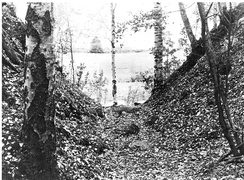
Från gruvans dunkel öppnar sig naturen ut mot ljuset från Utanmyras åkrar och Agnmyrens vattenspegel.

Exteriört sett är gruvan i Klikten ett dagbrott med en 36 meter öppen ort som på sina djupaste ställen är 6,3 meter från botten upp till övre kant. Botten är dock numera täckt av lösa stenar och nedfallet berg och brottets djup kan därför endast ungefärligen anges. Gruvan är 3,5 meter som bredast och avsmalnar till 2,4 meter i södra begränsningen, där den också är grundast. Ungefär i mitten av brottet finns ett avsmalnande parti, där ett mindre ras inträffat. I djupaste partiet av gruvan har brytning skett in mot och under bergväggen och att arbetet inte kan ha varit helt riskfritt, visar lösa stenpartier i det skiktrika kalkstensberget. På ett ställe sipprar en liten källåder fram mitt i berget och fuktar hållarna för att droppvis försvinna ned bland de nedfallna stenarna. Från brottet leder en 18 meter lång förbindelseled ut mot den körväg, som slingrar sig utmed Agnmyrens östra strandkant. Strax norr om gruvan finns i förkastningsbranten ytterligare en öppning i markskiktet som visar, att fle-