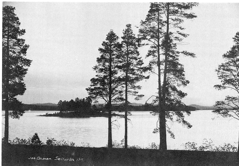
Skymning vid Siljan

Samtidigt var det ju en fördel att inte vara beroende av noter när det var fråga om stumfilmsspelningar, för även på lilla Sollerön förekom sådana i filmens barndom.