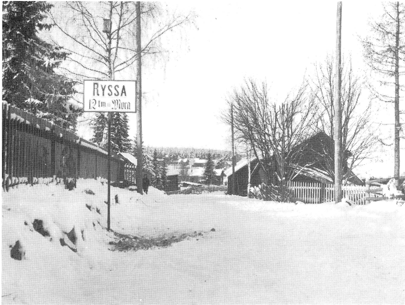
Landsvägen genom Ryssa. Vy från södra infarten med Stoltgårdens uthus till höger.