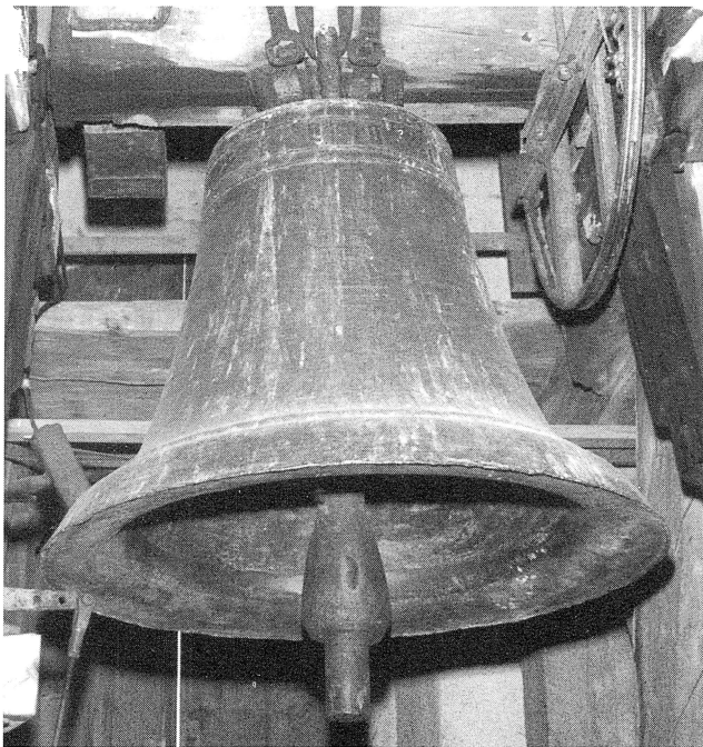
Storklockan från 1530.