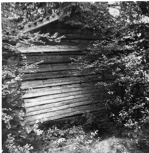
Stugan, mjölkammarens vägg.