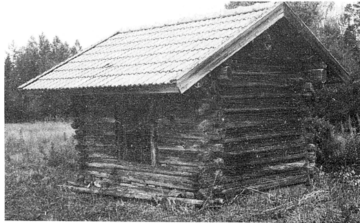
Gammal lada med nytt tegeltak.

och misu-grytan i spisen, "lidukuppan" och "sturkuppan" på väggen och "tjinnok"* och träskålar i mjölkstugan. Där hade de unga rottrådar varit fästade och deras anmödrar strävat. —