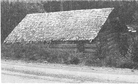
Gammal ladugård med spåntak, N.Selen.