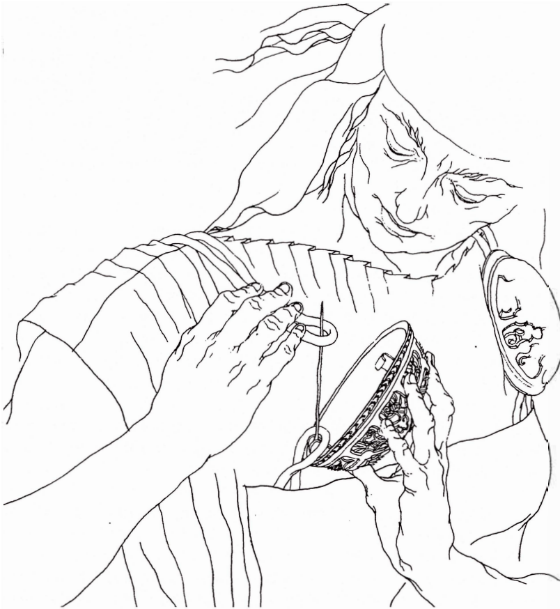
Kvinna, som med spännbucklor fäster upp sin klädedräkt.