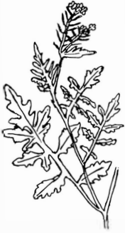
STRANDFRÄKE ( Roxippa silvestris )