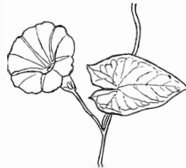
SNÅRVINDA ( Calystégia sépium )