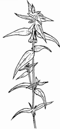
LUNDKVALL el. MATTODAG ( Melampyrum nemorosum )