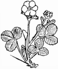
BACKSMÅTRON ( Fragaria viridis )