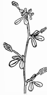
HUMMELUSERN ( Medicago lupulina )