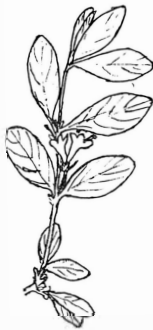
BLÅTRY ( Lonicera coerulea )