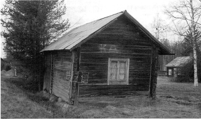
"Lindbergs kafé i Björka" mitt första möte med Sollerö socken