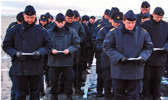
Psalmsång. Delar av HMS Visborgs besättning.