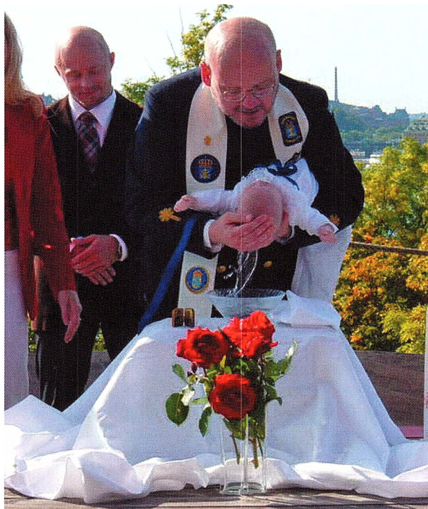
Dop på Kastellet's tak i Stockholm.