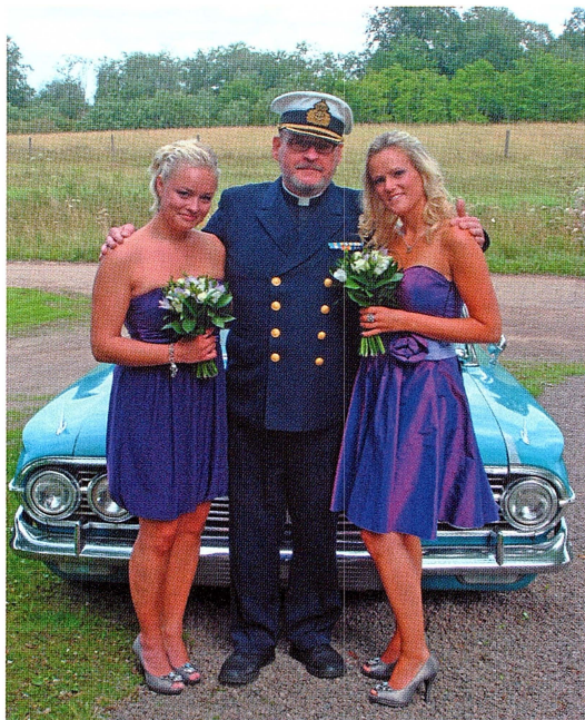
Det är något särskilt med blanka knappar

Men visst fanns det en mycket allvarligare verklighet också. Det är nog lätt att förstå att Flottan är en mycket farlig arbetsplats. Dessutom var dess personal ständigt utsatt för det jag skulle vilja kalla politisk terror. Vart fjärde år tas ett nytt försvarsbeslut och unga familjer måste flytta från en ort av landet till nästa. Bostäder i Stockholm är inte så svåra att bli av med, men de som var anställda på Helikopter fick flytta från Karlsborg till Berga och sen till Malmen. 90 lediga villor i Karlsborg från en dag till en annan och dessutom insats till boende i Sveriges kanske dyraste bostadsområde? Familjetragedierna var dessvärre många. Då kunde pastorn vara ett stöd.