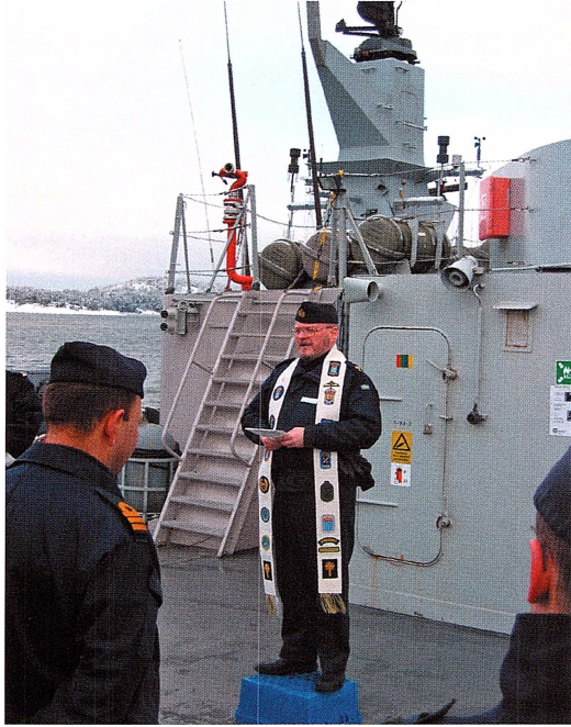
Till sjöss duger en tomback som predikstol.