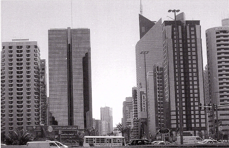
På denna gata bodde jag.

Arbetet som flygvärdinna har tagit mig till jordens alla hörn, och har även inneburit att jag kunnat ta med min familj på äventyr. Jag har dykt och sett hajar i Oman, druckit glühwein på en julmarknad i München, ätit världens godaste pannkakor i Toronto, sjungit med en gatumusikant i London, åkt gul taxi i New York, varit på hysterisk tuktusightseeing i Bangkok med min bror, ätit skaldjur med min moster i Manilla, dansat på gatorna i Dublin, sett lejon jaga vildsvin på safari i Kenya med min mamma, rullat nedför en blommande ängsbacke i Geneve, spelat kort med min mormor på en strandservering i Fujairah, kört längs slingriga vägar i Milano, nästan kört på en kamel mitt i öknen med min pappa och sett solen gå ner över Sydneys operahus. Jag har även blivit jagad av tre män i Casablanca, fått kackerlackor i maten i Kuala Lumpur, gråtit över utmärglade människor i Colombo, sett hundratals tiggande barn utanför flygplatsen i Dhaka och blivit bestulen på mina tillhörigheter i Bryssel. Jag kan dock utan tvekan säga att mina upplevelser till absolut största delen varit positiva. Allt jag sett och fått uppleva har gjort mig till den jag är idag och jag ångrar inte en sekund att jag tog chansen att arbeta som flygvärdinna i Förenade Arabemiraten.